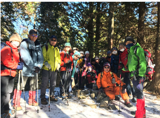
大比叡山の三角点 一等点峰です！