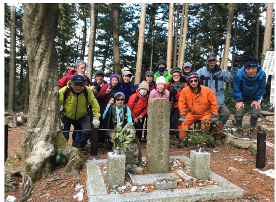
紀貫之の墓前にて 男もすなる日記を今年はしてみむ？