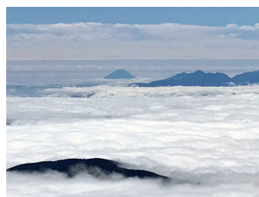
【蝶ヶ岳から富士山】