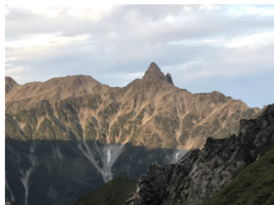
【大天井岳から槍ヶ岳】