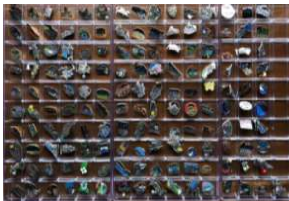
【収集したピンバッチ】

最近、テント泊とか冬山山行などで山小屋に立ち寄る機会が少なくなったが、200個を目指したい。