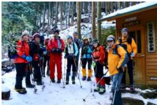
ヒメズ谷出合小屋