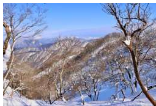
ブナ林からの景色