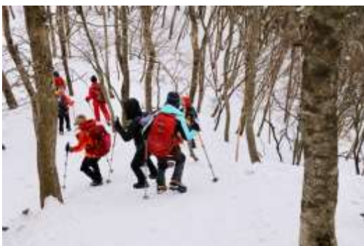
八合目付近を下る