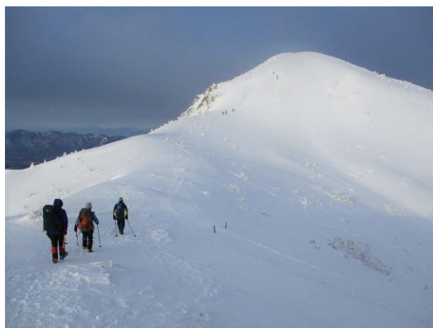
西天狗岳に向かう