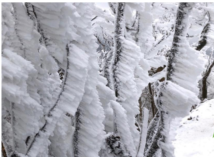
大きなエビの尻尾

はじめてエビの尻尾を観ることができて嬉しかったです。山頂付近の寒さは凍えそうで、強風に飛ばされたエビの尻尾の破片と思いきものが顔に当たって痛かったこと！けれど、銀世界の景色が綺麗だったこと！非日常の体験に感動しました。帰りのバスで飲もうとしたペットボトルの水が凍っていて、これにもびっくりでした。楽しい山行をありがとうございました。