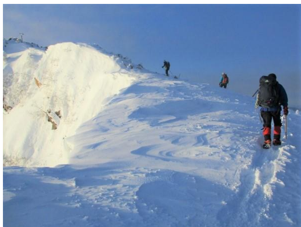
東天狗岳頂上の手前

既に当初計画の天狗岳(2月)の参加申込みされた方も、あらためて申し込んで下さい。 申込時に車提供の可否と、集合場所を連絡してください。