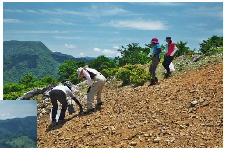
頂上での清掃風景