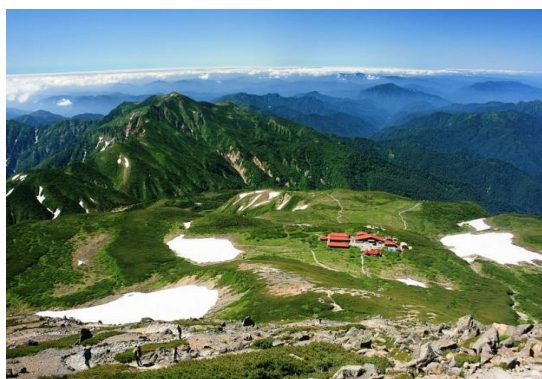
<御前峰からの眺望>