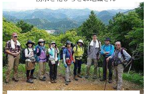
大斎原の鳥居を遠景に