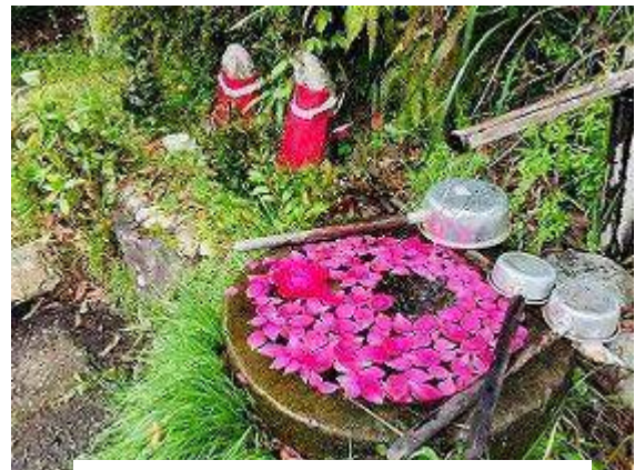
湧水と花びらとお地藏さん