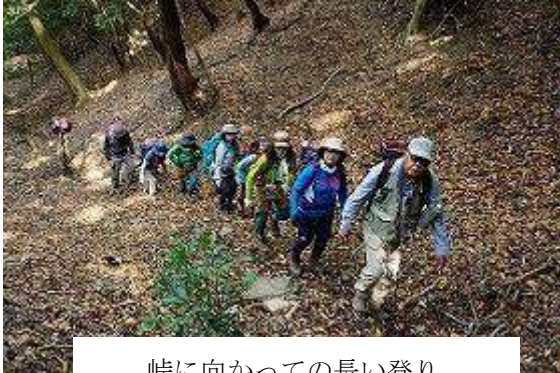
峠に向かっての長い登り