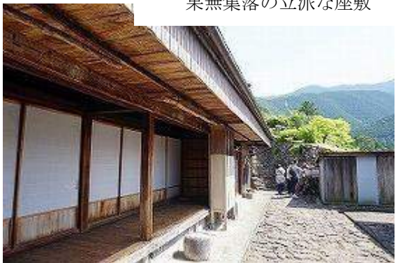
果無集落の立派な座敷

下りに入り、観音堂で休憩、シャクナゲが開花、水も豊富でキャンプ地に最適。 更に下って果無集落、2軒しかないが周りは整備され、よくこんな高地に集落が、とただただ感嘆するばかり。