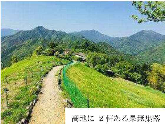
高地に 2 軒ある果無集落