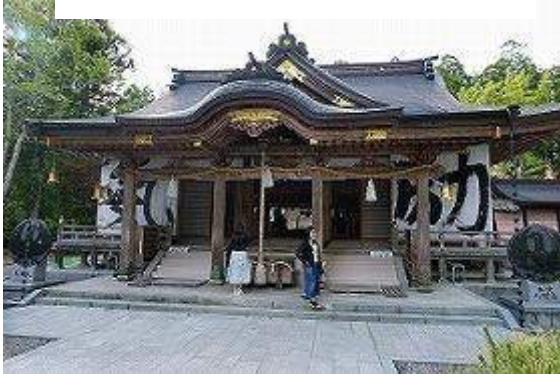
熊野本宮大社に参拝