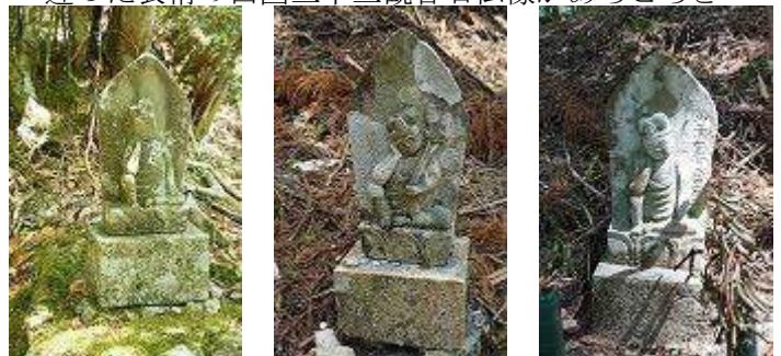
違った表情の西国三十三観音石仏像があちこちと