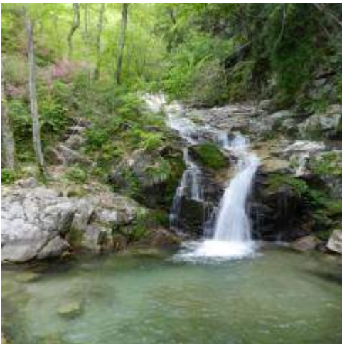
大摺鉢（広さ 60 坪程の擂鉢型）