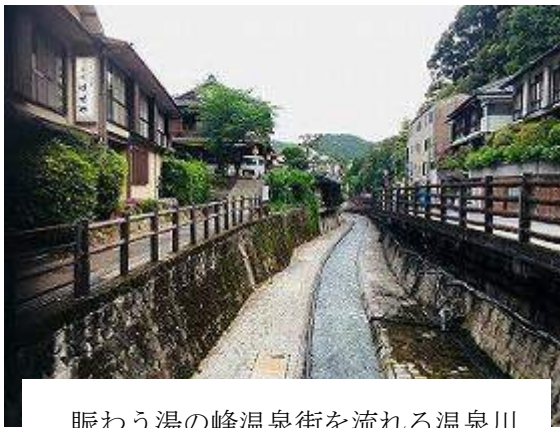
賑わう湯の峰温泉街を流れる温泉川

歩いたあと、3日は湯の峰温泉、4日は渡瀬温泉(夕食後、一部は川湯温泉へも)で疲れを癒す。