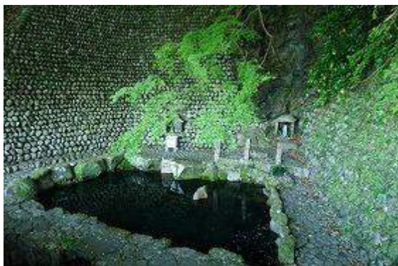
尾根近くで湧き出る野中の清水

三越峠で昼食、一息つく。ここからは発心門王子まで谷筋の小道が続く下り道、最後は登り道をこなして広々とした発心門王子に到着して今日の歩きを終える。