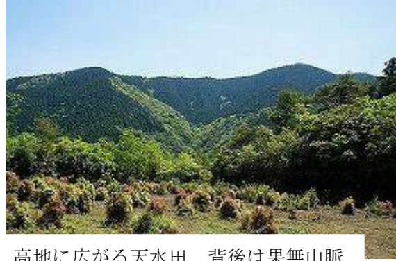
高地に広がる天水田 背後は果無山脈