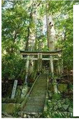
天を衝く野中の一方杉