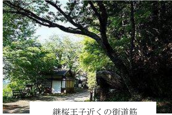
継桜王子近くの街道筋