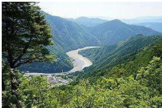
尾根道から眺める熊野川と山なみ

3日目は高野山から熊野本宮大社までの小辺路の一部を逆コースで歩く。10.6kmの本格的な登山と 言っても良いコース。バスの便が悪いので下山口まで車を廻し、八木尾から登り開始。 最初から急坂の連続、西国三十三番観音石仏像が随所で表情を変えて癒してくれる。途中の展望地 では大きく蛇行する十津川を挟んでの急峻な山並みは日本の奥地を代表するに相応しい。すれ違う歩 き人も多い。果無山脈・果無峠などの呼称に心惹かれ、やっと峠に到着。やや広い峠では大きな崩れた 石灯籠らしきものも残る。「ここは1114mのピークではないよね」との声に反応し地図を覗くとすぐ西に ピークがある。気にかかり登ってみると、なんと「果無山」とある。地図には表示ないが見つけられて ラッキー、あの一声がなかったら見過ごしただろうに。ここで萌黄新緑に囲まれながら昼食をとる。