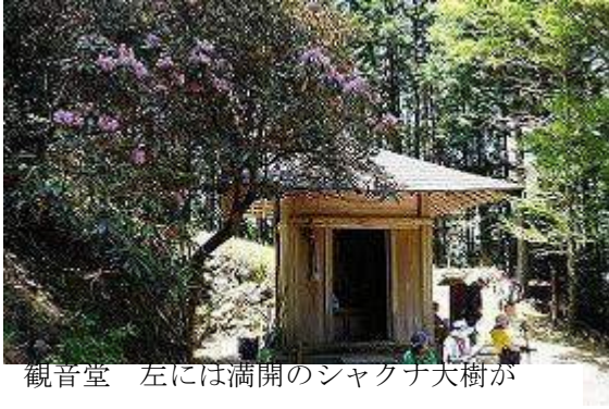
観音堂 左には満開のシャクナ大樹が