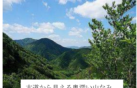
古道から見える奥深い山なみ

ここからは昨日歩いた熊野本宮大社への道、大半は下り坂だが集落を縫って茶畑や野菜畑が尾根道脇に広がり地元の生活臭を覗きながらの道は楽しい。案山子、無人販売所や茶処も顔を出し興味が尽きない。最後展望台からは大斎原(おおゆのはら)の大鳥居も拝望でき、熊野本宮大社へと下る。観光客で賑やかな大社では拝礼して中辺路歩きを終える。