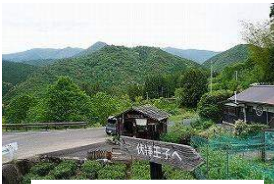
古道に沿っての集落

ここからは昨日歩いた熊野本宮大社への道、大半は下り坂だが集落を縫って茶畑や野菜畑が尾根道脇に広がり地元の生活臭を覗きながらの道は楽しい。案山子、無人販売所や茶処も顔を出し興味が尽きない。最後展望台からは大斎原(おおゆのはら)の大鳥居も拝望でき、熊野本宮大社へと下る。観光客で賑やかな大社では拝礼して中辺路歩きを終える。