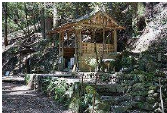
古道脇には観音堂が整備されている