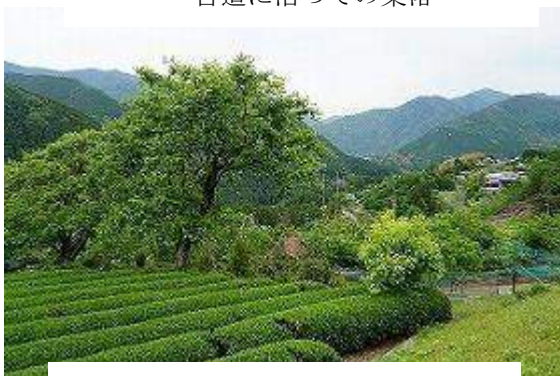
茶畑も随所に 手摘みも始まる