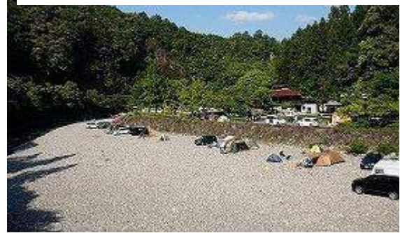
キャンプ場 奥に広い場所があるが入り きれず手前の河原にもあふれる盛況ぶり

夕飯は3・4日ともにキャンプ地で。食担係の三人が初めてのキャンプと言いながら腕を振るっていた だき充分満足できる食事となった。おかげで筆者はかなりの体重オーバー、赤信号が点滅!