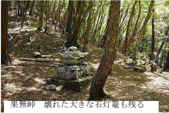
果無峠 壊れた大きな石灯籠も残る