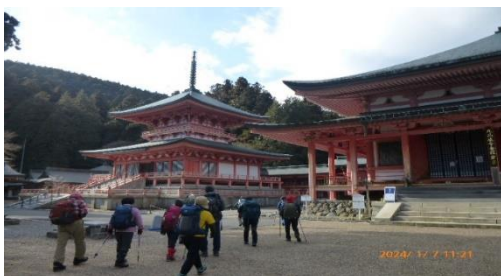
担い堂の下を抜け大比叡山に登る