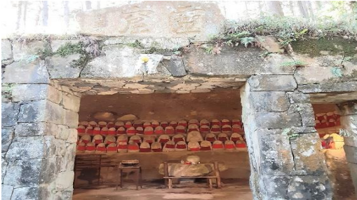
蓬萊丘地蔵（ケーブル建設工事で集められた）他にも山全体に多数の石仏ある

報告：新春の集い初めの、新春登山にふさわしい比叡山の聖地に詣でる 馴染みの参道コースですが、ひたすら登りはお正月鈍りの身体には辛い 晴天下で雪もなくアイゼンも使用せず、登山靴も衣類も汚れることなく 快い山行でした。下山後はお楽しみの岳友会の新年会へと向かう