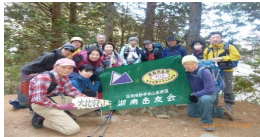
大比叡山頂上で集合写真