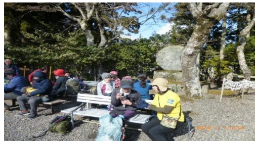
休憩（左下に根本中堂がある）